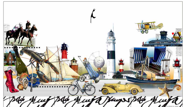
S Y L T