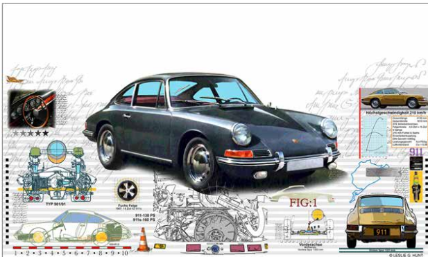
P O R S C H E 9 1 1